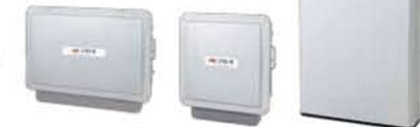
太陽電池モジュール ハイブリッドパワーコンディショナ DC/DCコンバータ 蓄電池ユニット